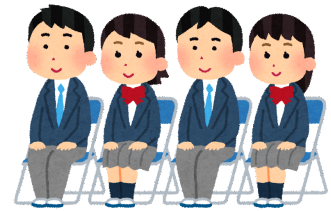
【真剣にメモする1年生】↓