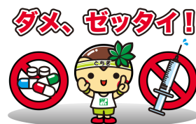
～2年1、2、3組 薬物乱用防止教室の様子～