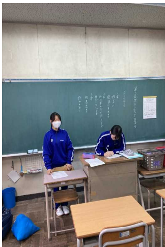
【ボランティア委員会】